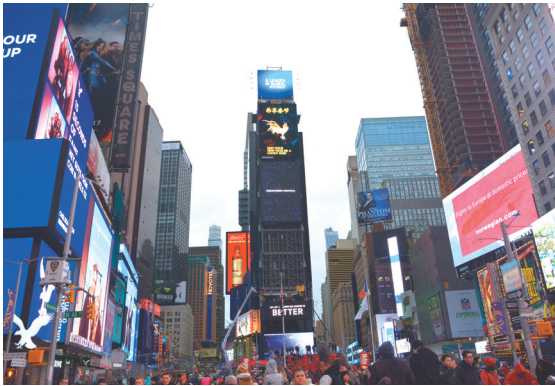
美国纽约时报广场中国屏，正在循环播出的《乐享春节》。

上线短短10天，境内视频平台播放总量已超过4000万次，境外社交媒体视频播放总量累计超过100万次，到达加拿大、