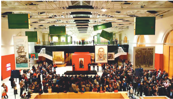
中国艺术展开幕式现场。

谢苗·米哈伊洛夫斯基院长是国际知名艺术家、威尼斯双年展的终身国际策展人。举办本次艺术大展，是他5年前的梦想，为此他多次到中国参观访问、实地考察、遴选作品，而且亲自设计了极具艺术创造力与震撼力的展览方案，可谓殚精竭虑。展厅设计以红色和绿色为总基调，其中红色展墙象征中国的长城，自屋顶垂悬