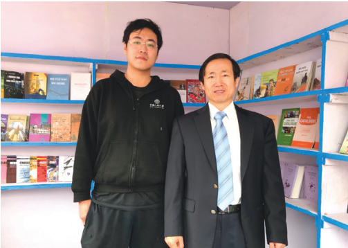
我社工作人员与中国驻加尔各答总领馆马占武总领事（右）在展台前合影。

书展期间，中国驻加尔各答总领馆马占武总领事、李素云领事等一行参观了我社展台，并对我社在推动中印文化交流方面做出的贡献给予了高度评价。（图书出版中心供稿）