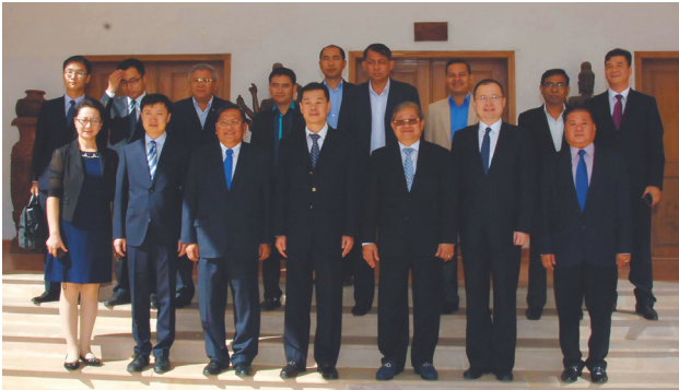
图为中方工作组与柬埔寨国家电视台举办播出启动仪式合影。

会后，2月7日至8日以党支部为单位，将社领导班子民主生活会情况向全体党员进行了通报。目前，我社领导班子全面落实从严治党责任，认真抓好整改任务落实工作，做到分工到人，责任明确，以良好精神面貌和优异成绩迎接党的十九大胜利召开！（社党委供稿）