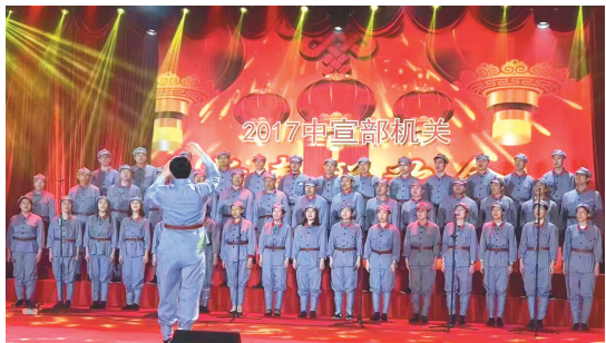
图为2017年中宣部机关春节联欢会彩排现场。