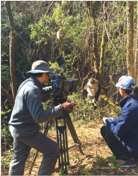
春节期间，“五洲”工作人员仍在忙碌地拍摄。

路通了，村里的汽车也多了起来，空场上甚至停着两辆厢式货车。一打听，原来是两个我本家的兄弟自购货车做起了快递业务。按照家乡的习俗，初二开始挨家走亲戚，期间，我曾数次跨越南水北调干渠。许多道路因南水北调而改变了走向，路宽了，过去的沙石路面也全都铺上了柏油。一座座标志性的“彩虹桥”飞跨干渠两岸。走在桥上，扭头看两侧碧波荡漾的清水一路向北，想到在北京也能喝上家乡水，豪迈之情不禁涌上心头。我要为家乡喝彩！