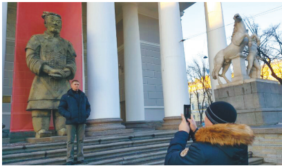
展览期间，在巨型兵马俑雕塑前留影的俄罗斯观众。

1月下旬的俄罗斯圣彼得堡，是这个位于波罗的海之滨、离北极圈很近的城市最寒冷的日子，而《华夏文明之光》中国艺术展的展出，却给这个被严寒笼罩的“文化之都”带来了一股热流。1月20日至2月12日，由我社与解放军艺术学院等单位共同主办的《华夏文明之光》中国艺术展在俄罗斯圣彼得堡马涅什中央展览大厅隆重展出。展览受到了该市市民的极大关注，争相前往参观，在短短20多天时间里，接待观众2万多人，创下了该市艺术展参观人数的新纪录。如今，展览虽已落下帷幕，但办展过程中的一个个精彩细节，仍值得我们久久回味和珍藏。