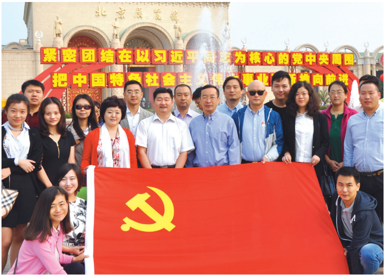
我社第一党支部参观大型成就展。

本报讯 9月27日至30日，我社所属四个党支部部分五批组织党员集体参观“砥砺奋进的五年”大型成就展，开展主题党日活动。先后组织近百名党员和入党积极分子参观，部分党员在中秋国庆节期间自发前往参观展览。 同志们纷纷表示，参观大型成就展，使我们更加深刻地理解了以习近平同志为核心的党中央治国理政新理念新思想新战略，更加全面地了解了党的十八大以来所取得的伟大成就，进一步筑牢了“四个意识”，进一步增强了基层党组织的凝聚力、战斗力，鼓舞激励我们以高度的政治责任感和昂扬的精神状态做好各项工作。（社党委供稿）