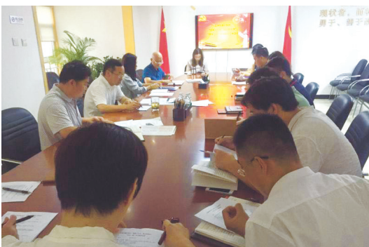
图为我社第一党支部开展“喜迎十九大、做合格党员”“两学一做”学习教育答卷活动现场。

本报讯 为迎接党的十九大，增强“四个意识”，推进“两学一做”学习教育常态化制度化，我社自 7 月至 10 月推出“喜迎十九大、做合格党员”系列主题教育实践活动，内容丰富多彩，工作成效显著。