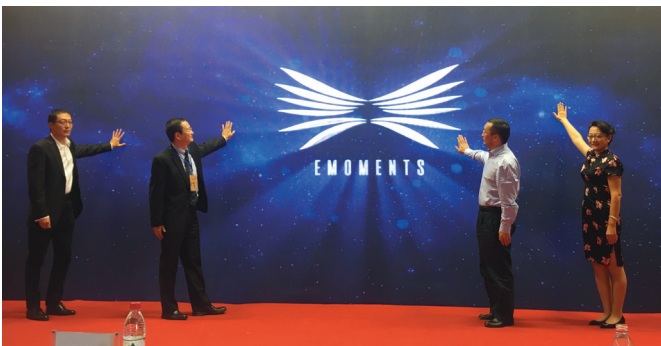
“中华之美”海外传播计划启动仪式现场。

本届中国（嘉峪关）国际短片电影展还揭晓了“弘扬中华优秀传统文化”主题纪录片推优作品的结果，我社纪录片《美丽乡村》获得了优秀作品荣誉。（王婉月 供稿）