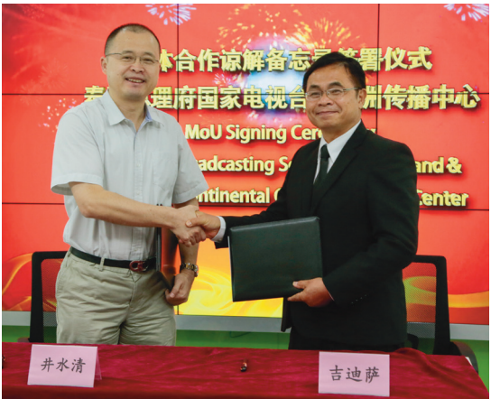
双方签署合作备忘录。

本报讯 9月18日，泰国总理府国家电视台 NBT 台长吉迪萨·汉科拉先生携泰国总理府宣传司、泰国总理府国家电视台代表团一行五人到我社望京办公区访问。中泰双方达成合作共识，希望在“一带一路”媒体传播联盟框架下，携手推进中泰文化交流。会谈后，双方签