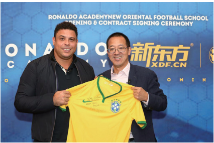
图为俞敏洪与足球巨星罗纳尔多共创足球项目。

的发展历史、业务布局情况和今年工作亮点。井水清副社长介绍了影视网络外宣业务特色和优势，愿与江苏同行共同讲好江苏故事、传播好中国声音。司锦泉副部长对“五洲”给予江苏省外宣工作支持和帮助表示感谢，并提出在联合制作外宣电视片、开展图书“走出去”和对外文化交流等方面进一步加强合作的想法，“五洲”社负责同志给予了积极回应。（总编室供稿）